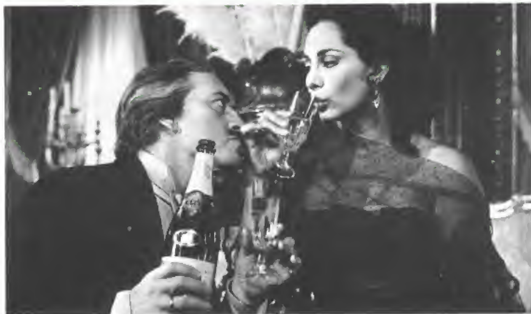
José Luis López Vázquez – Susana Dosamantes